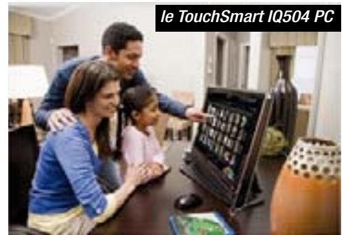
le TouchSmart IQ504 PC