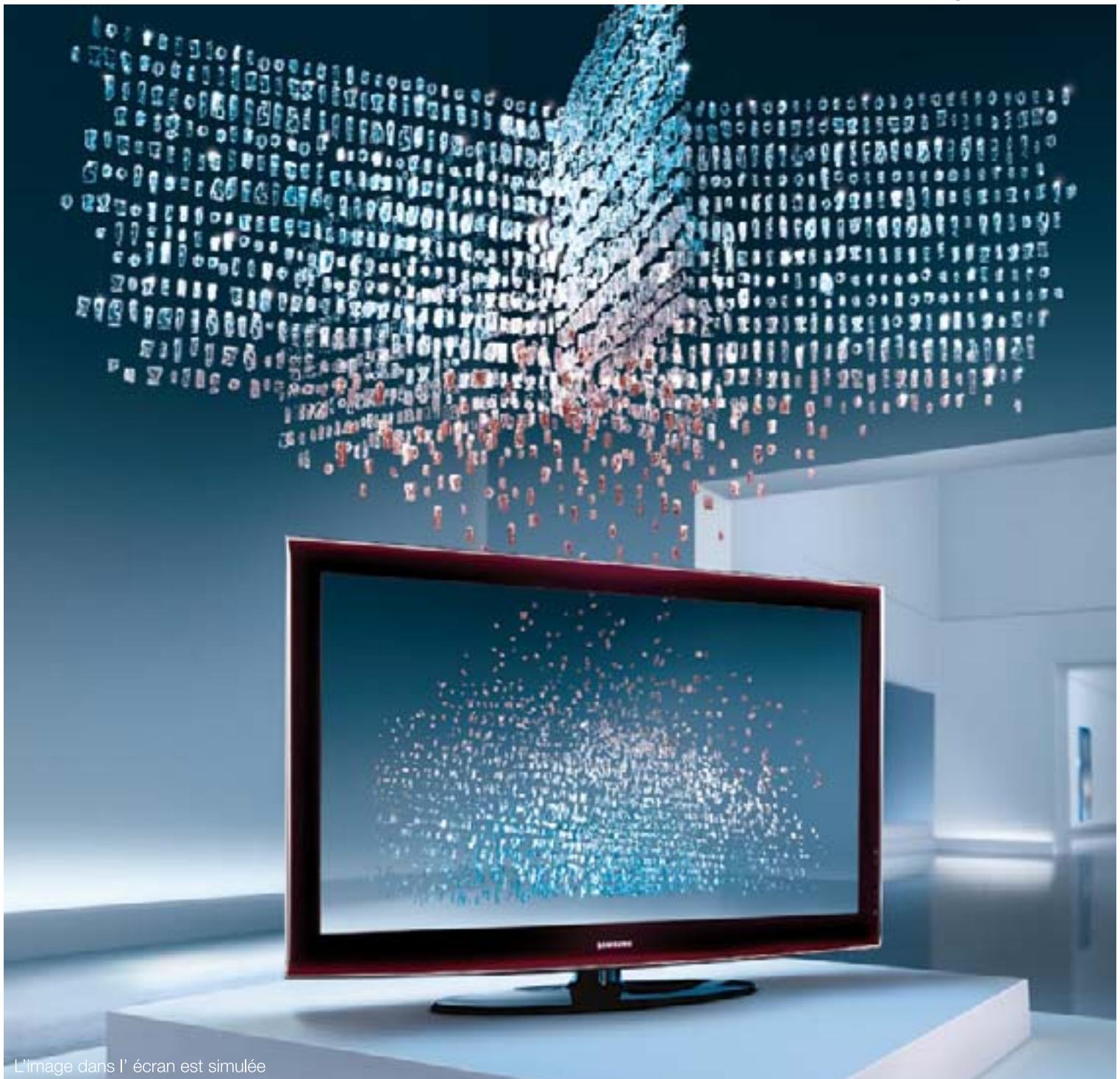
L'image dans l'écran est simulée